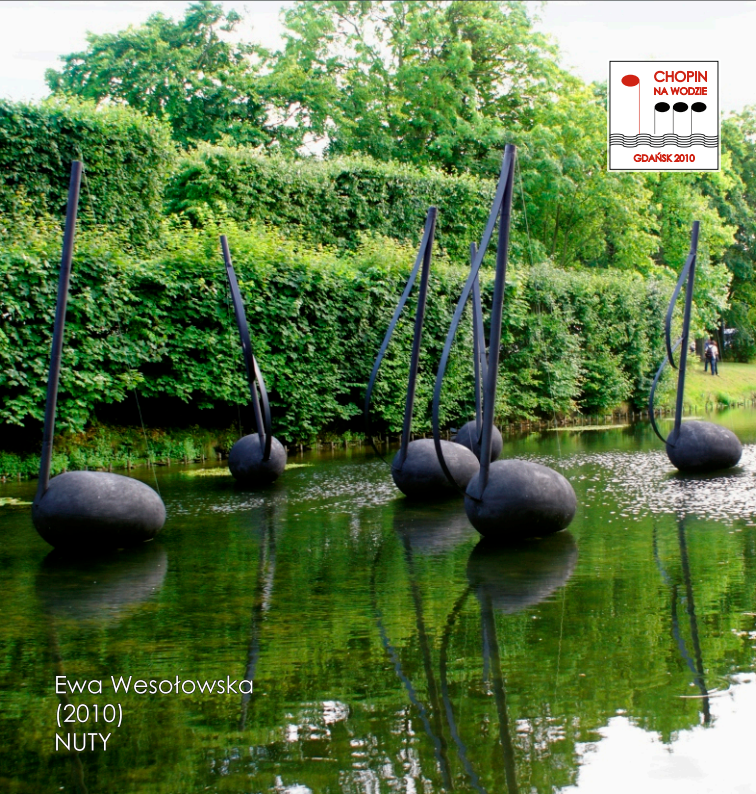
Ewa Wesołowska (2010) NUTY