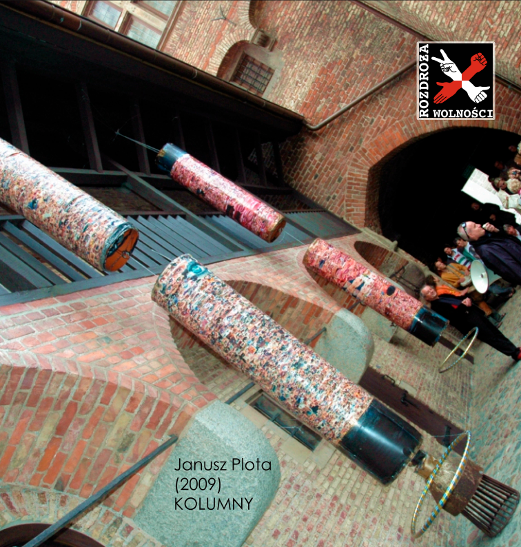
Janusz Plota (2009) KOLUMNY