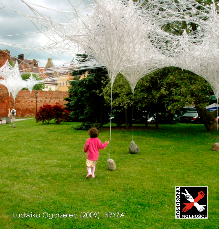
Ludwika Ogorzelec (2009), BRYZA